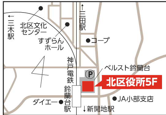
北区役所5階 【北区鈴蘭台北町1-9-1】