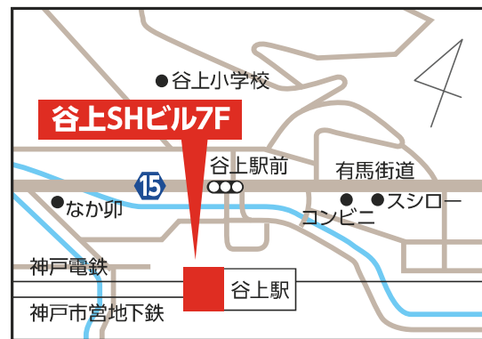
谷上SHビル7階 【北区谷上東町1-1】