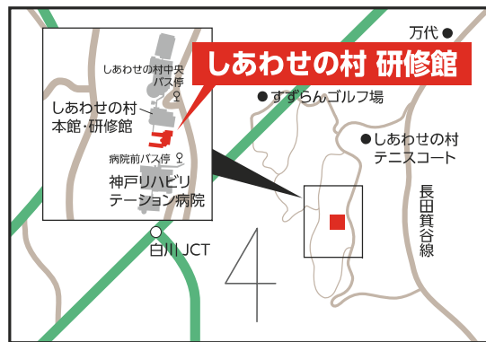
しあわせの村 研修館 【しあわせの村1-1】