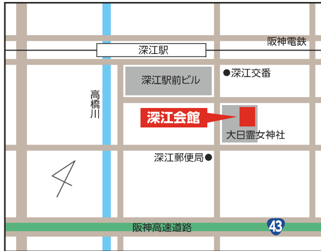
深江会館 【東灘区深江本町3-5-7】