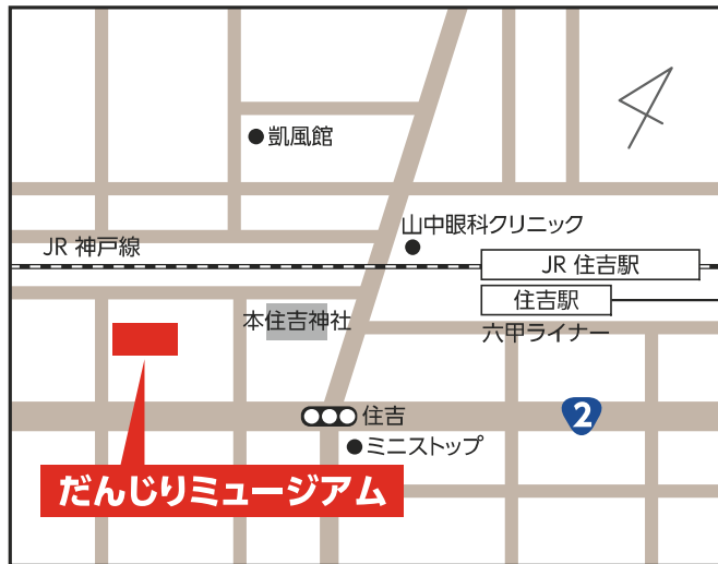
だんじりミュージアム 【東灘区住吉宮町7-2-17】