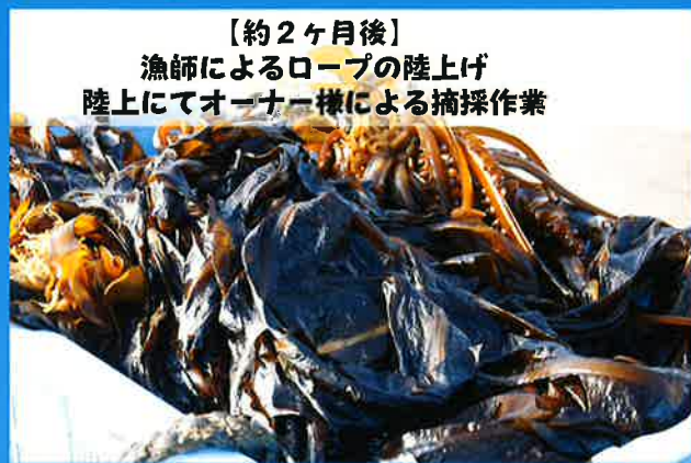
【約2ヶ月後】 漁師によるロープの陸上げ 陸上にてオーナー様による摘採作業

私たち須磨浦水産研究会では広く市民の皆様方に須磨の海のすばらしさ、また我々の仕事である漁業をより多くの方々に知って頂くために海や海産物とのふれあいの場を提供する事業に取り組んでいます。その事業の一環として今回「早採りワカメ」株付け体験オーナーを募集します。