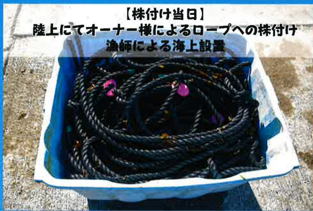
【株付け当日】 陸上にてオーナー様によるロープへの株付け 漁師による海上設置