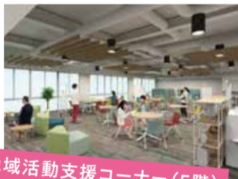
地域活動支援コーナー(5階)

コンセプトは“繋がりから成長へ”。西区の魅力発信、学生や福祉事業者の活躍の場、地域と企業との交流を行うスペースです。