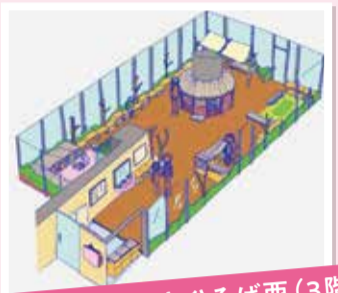
おやこふらっとひろば西(3階)

子育て中の親子が気軽に集い、語り、子育て相談や情報提供を行うスペースです(要予約)。