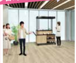
多目的スペース「こべや」(3階)

コンセプトは“繋がりから成長へ”。西区の魅力発信、学生や福祉事業者の活躍の場、地域と企業との交流を行うスペースです。