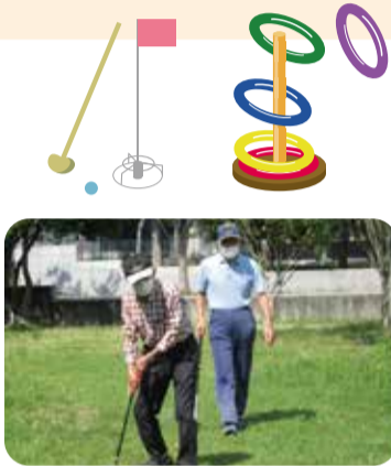
▲西神美春クラブ・西神第一・二・三美賀多台クラブ

グラウンドゴルフやゲートボール、輪投げ、健康体操などに取り組んでいます。新しいスポーツも積極的に取り入れ、最近では、だれでも簡単に楽しめるポッチャが人気を博しています。