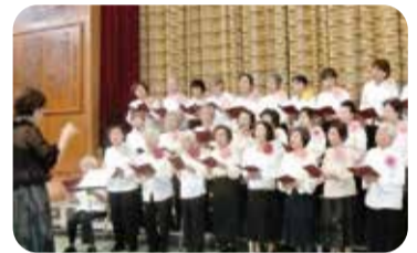
▲押部谷老人クラブ・きらく会