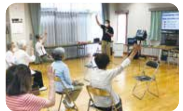
▲西神NT老人クラブ・オークヒルズクラブ

老人クラブでは新たな会員を募集しています。体験参加や一般(未加入)の高齢者を対象とした活動もあります。