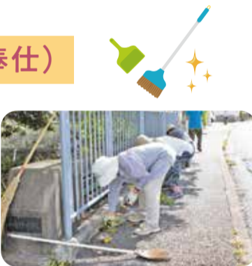
▲押部谷老人クラブ・楽栄会

美化活動、子どもの通学見守り、高齢者の見守りなどを行い、地域への奉仕活動に取り組んでいます。