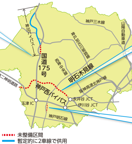
..... 未整備区間 —— 暫定的に2車線で供用