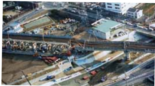
阪神・淡路大震災当時の西区の状況 西区内では火災の被害はなかったものの、建物の倒壊がみられました。 建物の倒壊:全壊436棟、半壊3,262棟 ピーク時の避難者数:1,787人

阪神・淡路大震災から22年。「当時、西区は他区と比べて被害が少なかったから大丈夫!」 と考えていませんか。いざというときに備えて、今日からできることを始めましょう。