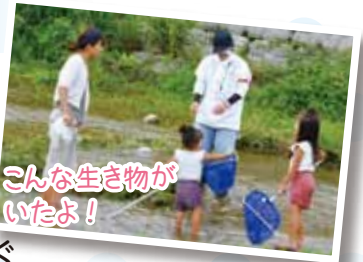
こんな生き物がいたよ!

日時 9月3日(土) 14:00~17:00 場所 榎谷町榎木地区河川敷 アクセス 地下鉄「西神中央」から神姫バス⑬で「長谷南口」下車すぐ 問 榎谷川愛護協議会(榎谷連絡所内) ☎991-1001 FAX993-2038