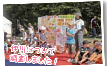
伊川について調査しました!

日時 8月6日(土)14:00~17:00 場所 伊川ふるさと区民広場 アクセス 地下鉄「伊川谷」から神姫バス⑭(伊川谷小学校経由)で「新末田橋」下車 問 伊川を愛する会(伊川谷連絡所内) ☎974-0001 FAX978-2004