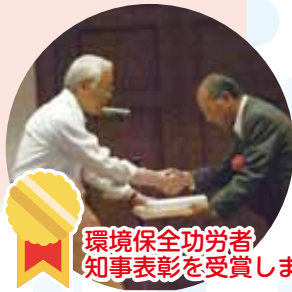
環境保全功労者知事表彰を受賞しました