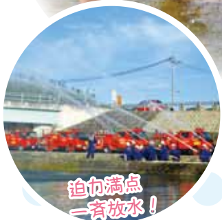
迫り満点一斉放水!

7月は河川愛護月間です。西区では地域の皆さんの手によってきれいな川が保たれています。今年も川祭りで楽しい夏を過ごしましょう。