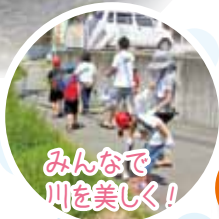
みんなで川を美しく!