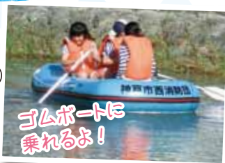
ゴムボートに乗れるよ!

日時 7月23日(土) 15:00~18:00 場所 明石川平野橋河川敷周辺 アクセス 地下鉄「西神中央」から神姫バス③7で「平野連絡所前」下車 問 平野町明石川愛護協議会(平野連絡所内) ☎961-2001 FAX963-2001