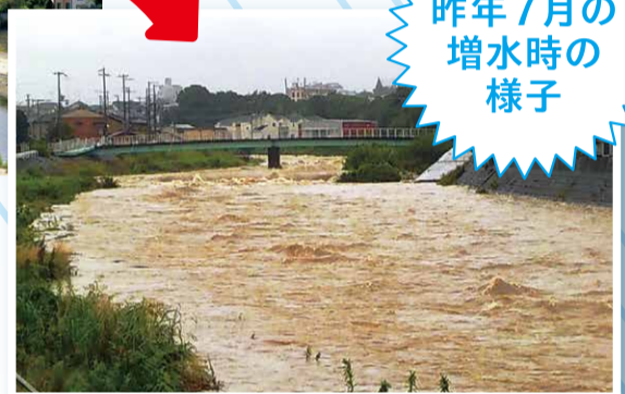
昨年7月の 増水時の様子