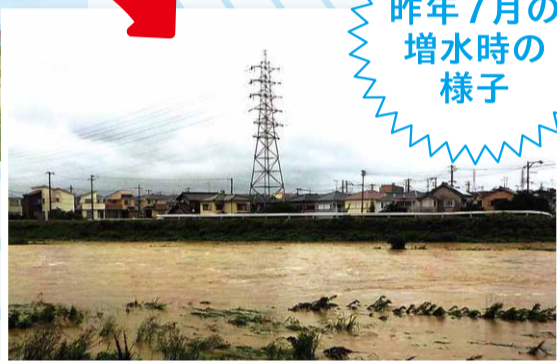
昨年7月の 増水時の様子