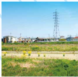
普段の明石川 (今津周辺)

昨年度は例年に比べ自然災害が非常に多く、緊急避難場所が多数開設されました。災害時は身の回りの安全を確保し、緊急避難場所に向かいましょう。