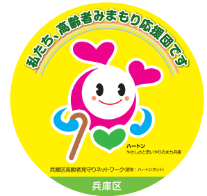
↑みまもり応援団の目印 ハートンのステッカー

この活動に賛同・協力してくださる事業所の登録を、担当のあんしんすこやかセンターで随時受付しています。ご登録いただいた事業所には、ステッカーを配布し、「兵庫区高齢者みまもり情報マップ」(本冊子)に掲載します。