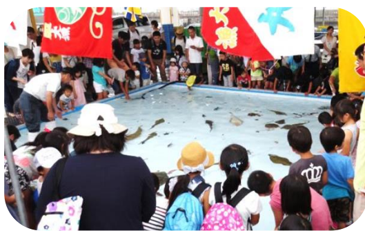
めずらしい魚がいっぱい！（タッチプール）