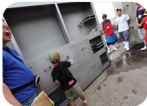
防潮堤稼働の体験！