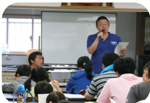
長田の漁業のお話！

場 所：駒ヶ林浦漁業会集会所前（駒ヶ林町4丁目3-2） 定 員：20組（小学生1名と保護者1名）抽選で決定 料 金：1組1,000円（当日支払い） 結果通知：当落は後日お知らせします。