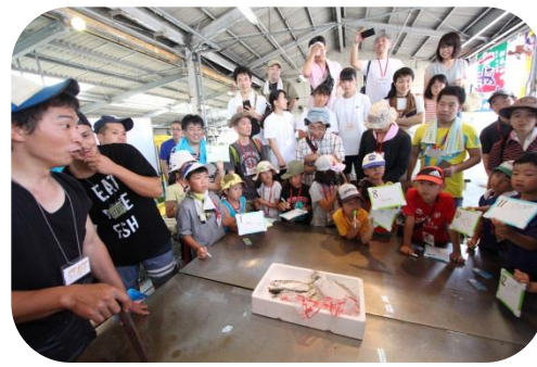
どんな魚が出るか楽しみ！（せり体験）