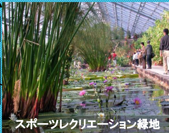
スポーツレクリエーション緑地