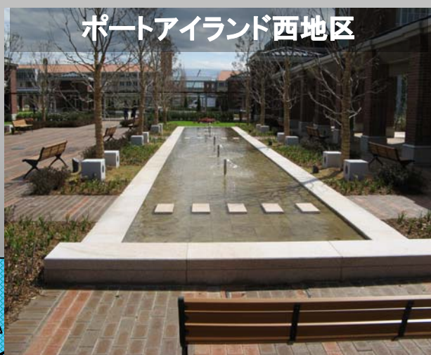
ポートアイランド西地区