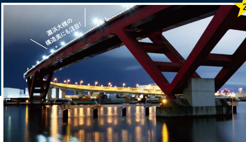
YAKEI No.2 灘浜緑地 灘浜東町

都賀川河口にあり、神戸製鋼所に隣接して広がる公園です。灘浜大橋や工場の照明が水面に映る光景は、山からの夜景とは一味違った印象を与えます。波の音を聴きながら幻想的な風景をお楽しみください。