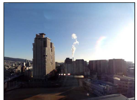
図 2. 写真例(平成 28 年 2 月 8 日 8 時)