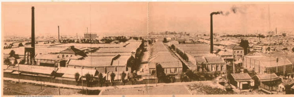
鐘淵紡績株式会社兵庫支店全景