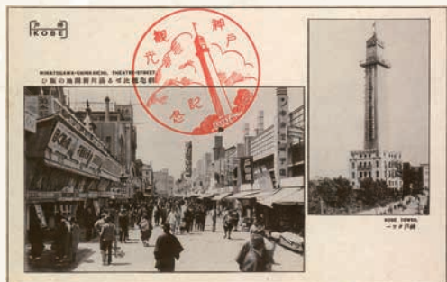
湊川新開地・神戸タワー

開港をきっかけに神戸の街は急速に近代化を遂げました。そのなかでも現在の兵庫区域は、明治に入ってから工場の立地や宅地開発などが進み、神戸の発展を支えました。その歴史的あゆみをたどりながら、90年前の「兵庫区」誕生の背景について考えます。