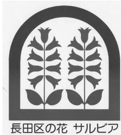
長田区の花 サルビア