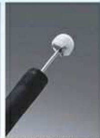
内視鏡的粘膜下層剝離術に使用する器具