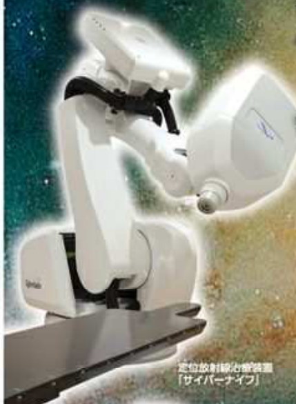
定位放射線治療装置 「サイバーナイフ」