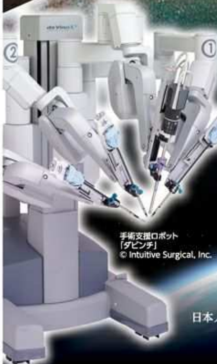
手術支援ロボット 「ダビンチ」 © Intuitive Surgical, Inc.