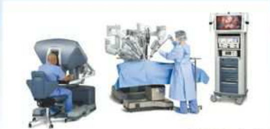
ダビンチ

ロボット支援手術では、人間の目で見るとより拡大された視野を立体的な3D画像で得ることができ、繊細で確実な操作ができるので、より患者の負担を減らした治療が可能になります。