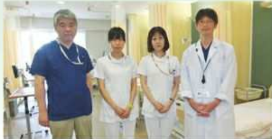
神戸市立医療センター 中央市民病院 外来化学療法センター医療スタッフ

抗がん剤の副作用は強いことが多かったのですが、最近は高い治療効果を上げながら副作用を抑える方法があります。患者の生活の質を高め、安全に効果の高い抗がん剤治療を行うことが可能となっています。