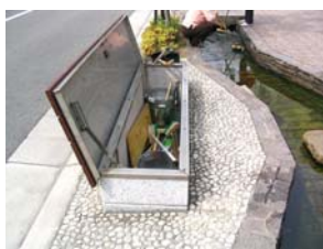
せせらぎ清掃道具