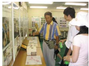
せせらぎパネル展