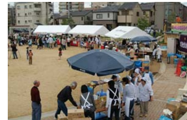
松本しょうぶ祭り 出店