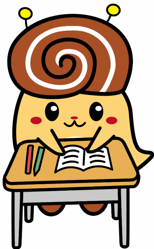
こころの健康づくりキャラクター "どんまい"