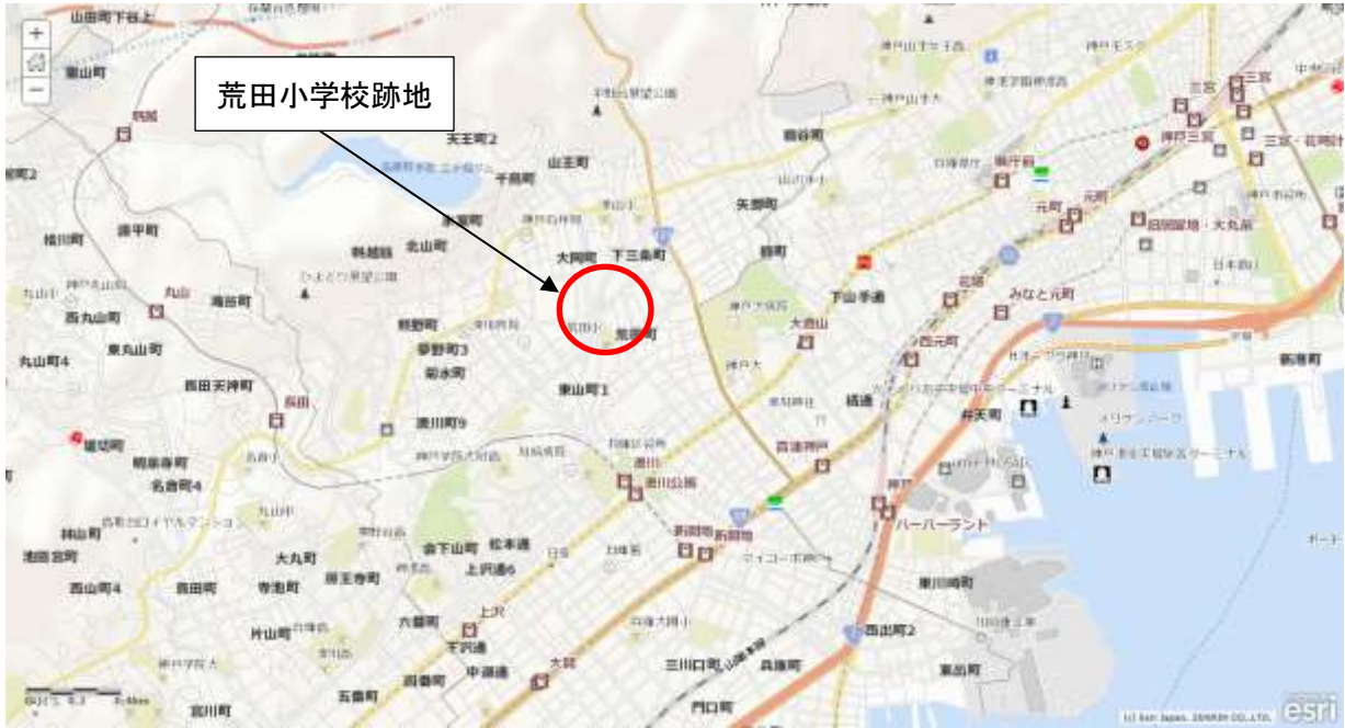
(C)2016-2017 ZENRIN CO.,LTD.(Z18EC 第 407 号)