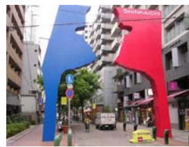
新開地 商店街の入口