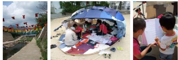
都賀川でのTシャツの通り抜け