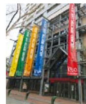
神戸アートビレッジセンター