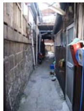
稲荷神社脇の小路