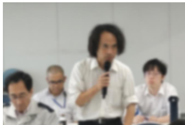
訓練振り返り・講評