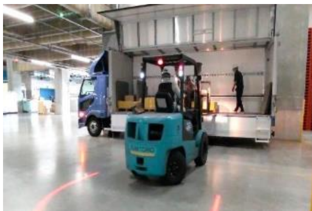
物資の配送・検品(一時保管倉庫:住友倉庫)