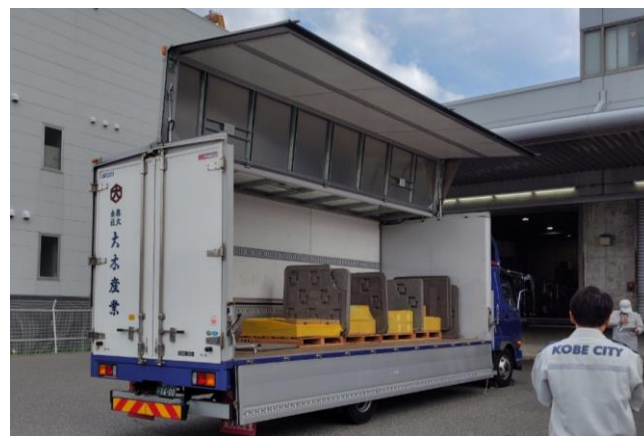
物資の積み下ろし