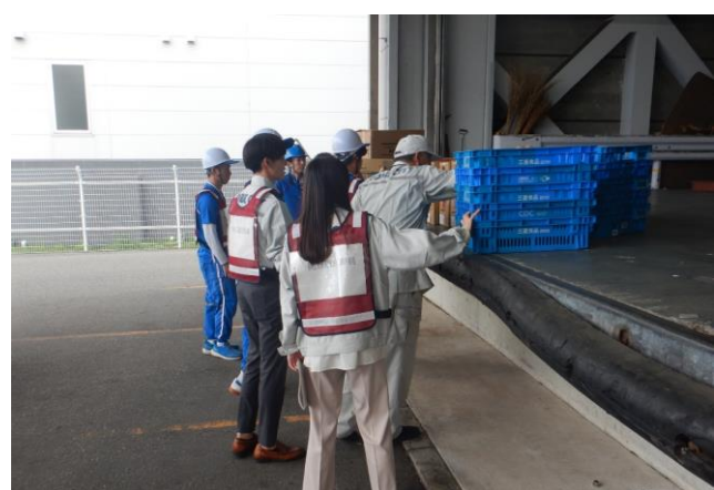
物資の積み込み・検品