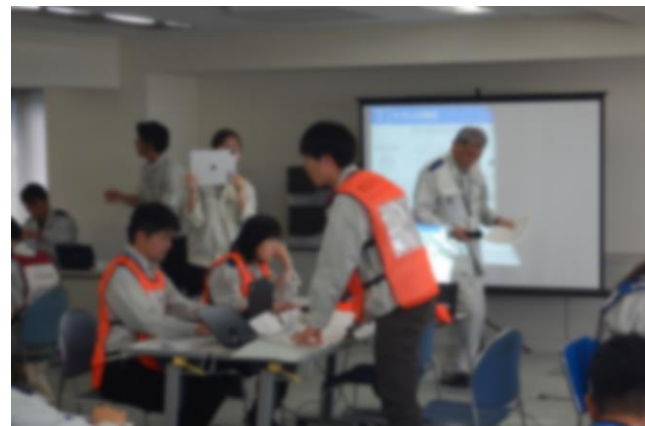
救援物資対策チーム