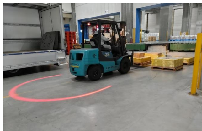
物資の配送・検品(一時保管倉庫:住友倉庫)