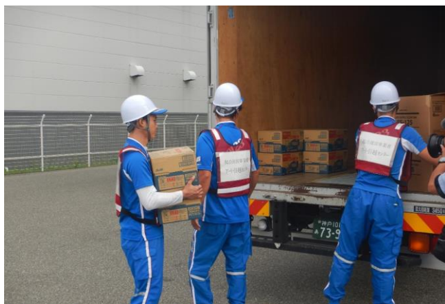
物資の積み下ろし