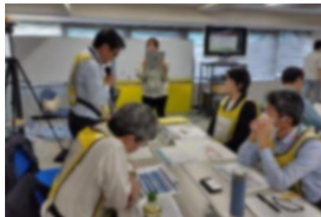
流通事業者との連絡