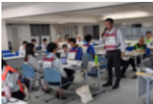
拠点運営事業者との連絡