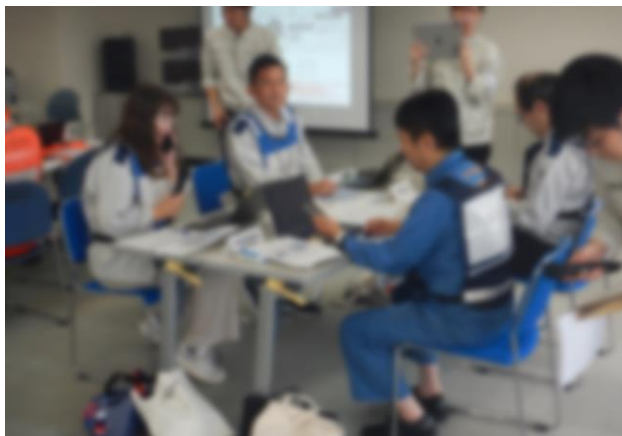
神戸市災害対策本部