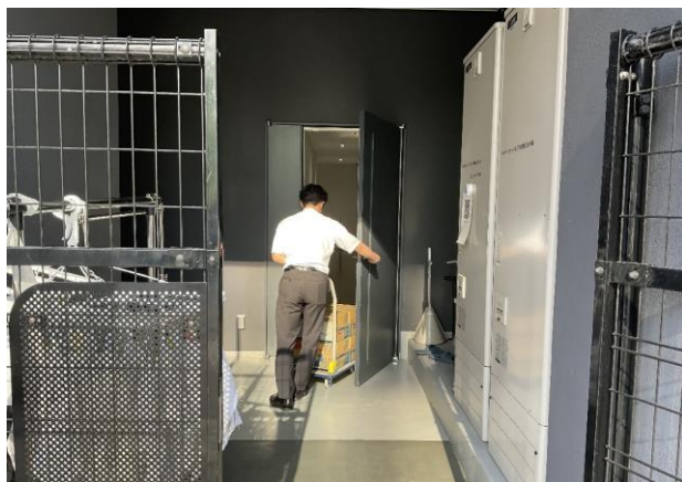
物資の配送(避難所:磯上体育館)