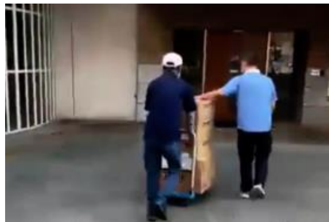
物資の配送(福祉避難所:ぽ一愛)