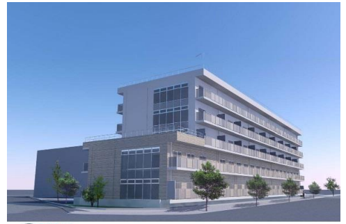
新船員宿舎建設工事の内 建築工事 A区-1区 2017.04.13