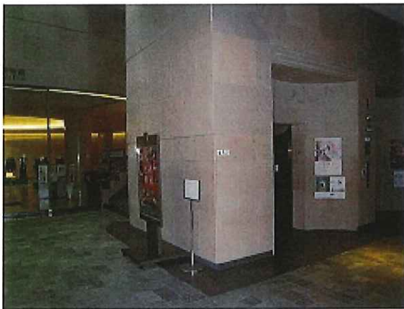
神戸ゆかりの美術館入口