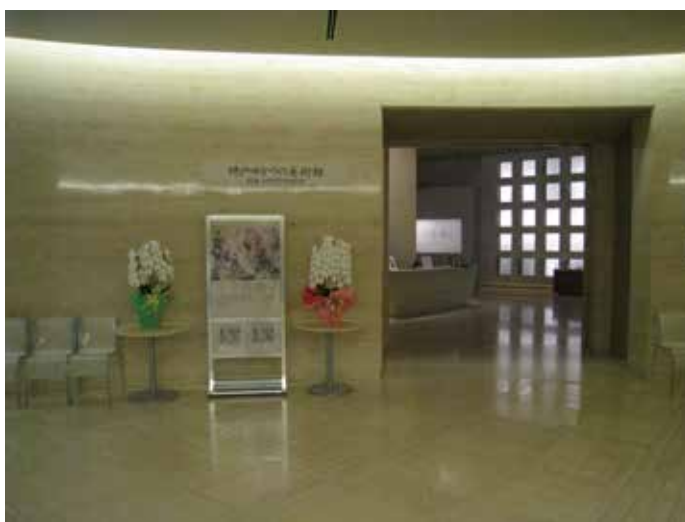
神戸ゆかりの美術館入口