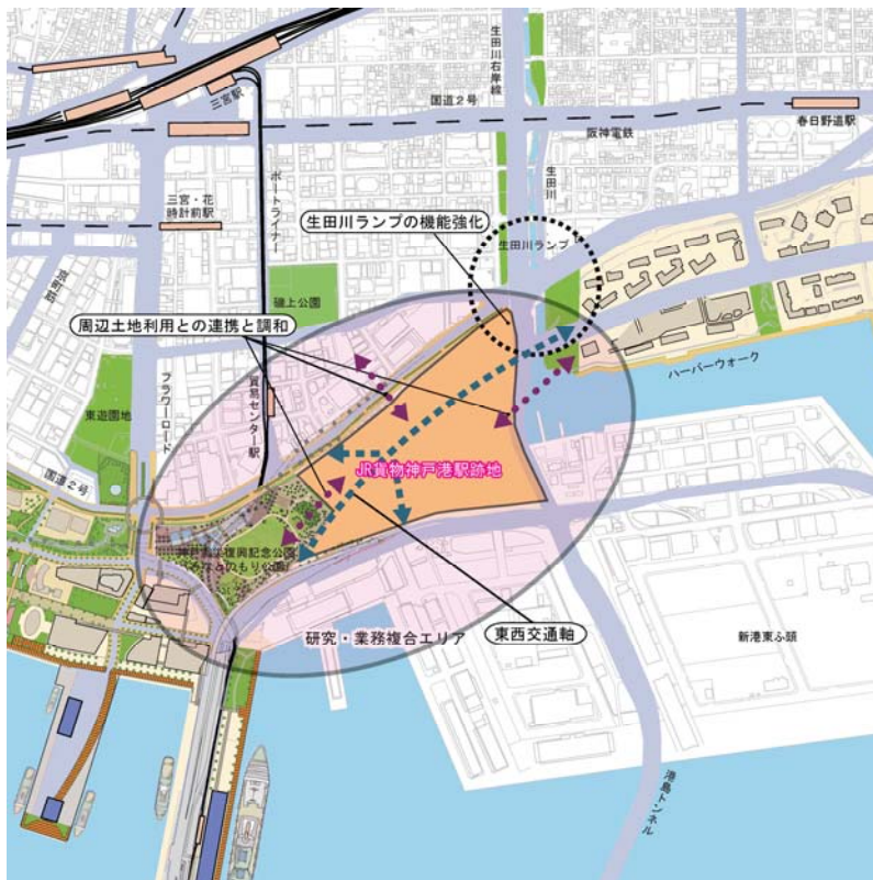
図2-7 JR貨物神戸港駅跡地の将来構想

※ ライフスタイルセンター機能：近隣住民（半径2キロメートルほどの小商圏の住民）を対象とした食・雑貨のショッピングセンター。