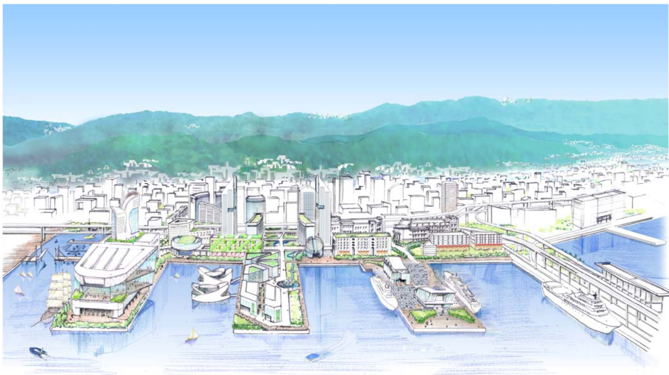
図2-6 新港突堤西地区のイメージパース