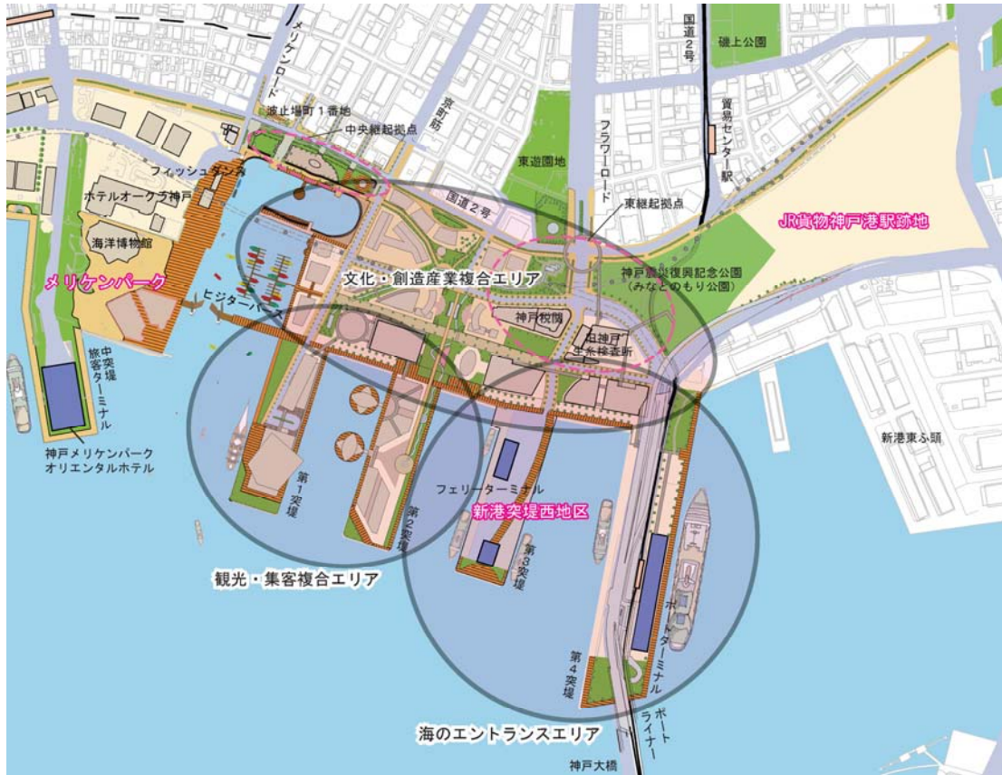
図2-3 中央ゾーンの都市機能の方向性

クルーズ船やフェリーなどの海上交通拠点としてのターミナル機能を拡充し、市民や観光客が船など、活きた港を身近に感じることのできる空間を形成する。また、海辺の賑わいや海の玄関口として、業務・集客機能を導入する。