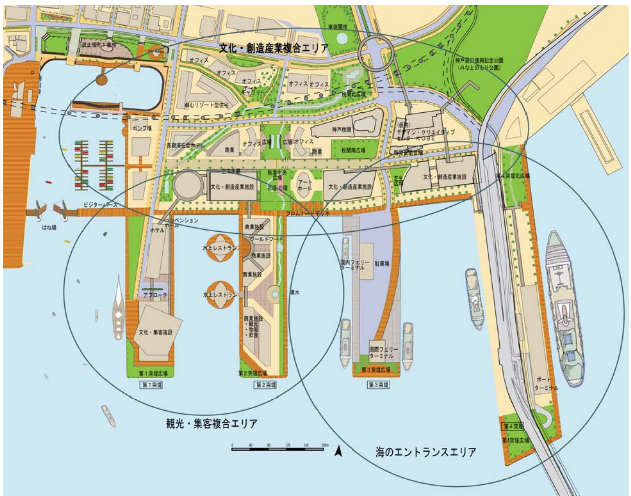
図2-5 新港突堤西地区の将来計画（イメージ）