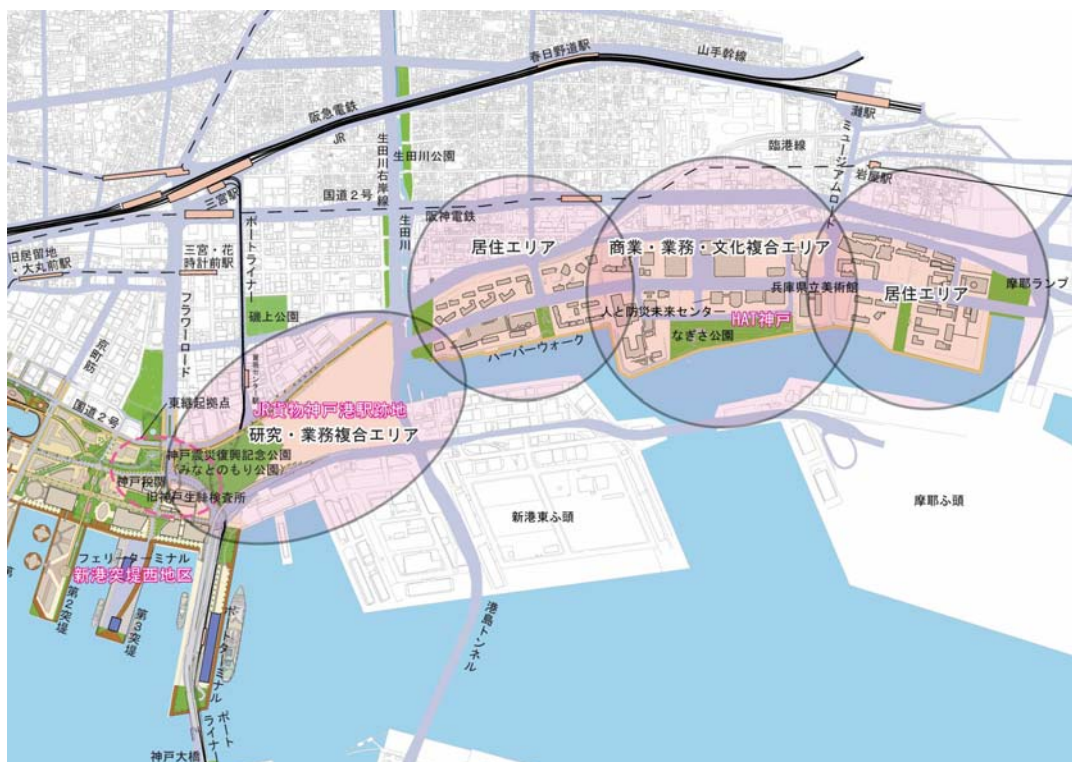
図2-4 東ゾーンの都市機能の方向性

HAT神戸では、中央には商業施設の他、兵庫県立美術館や人と防災未来センター、WHO神戸センター、JICA兵庫国際センターなど文化施設や国際的な業務施設などがあり、その東西に居住機能を有する。防災機能を高めるとともに、水際線においては親水空間として公園・プロムナードを整備し、海を身近に感じることのできる空間を創出している。引き続き、新しいコミュニティと文化を育むまちづくりや、前面の海の水辺活用など賑わいづくりを進めていく。