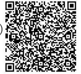
●e-KOBE の QR コード