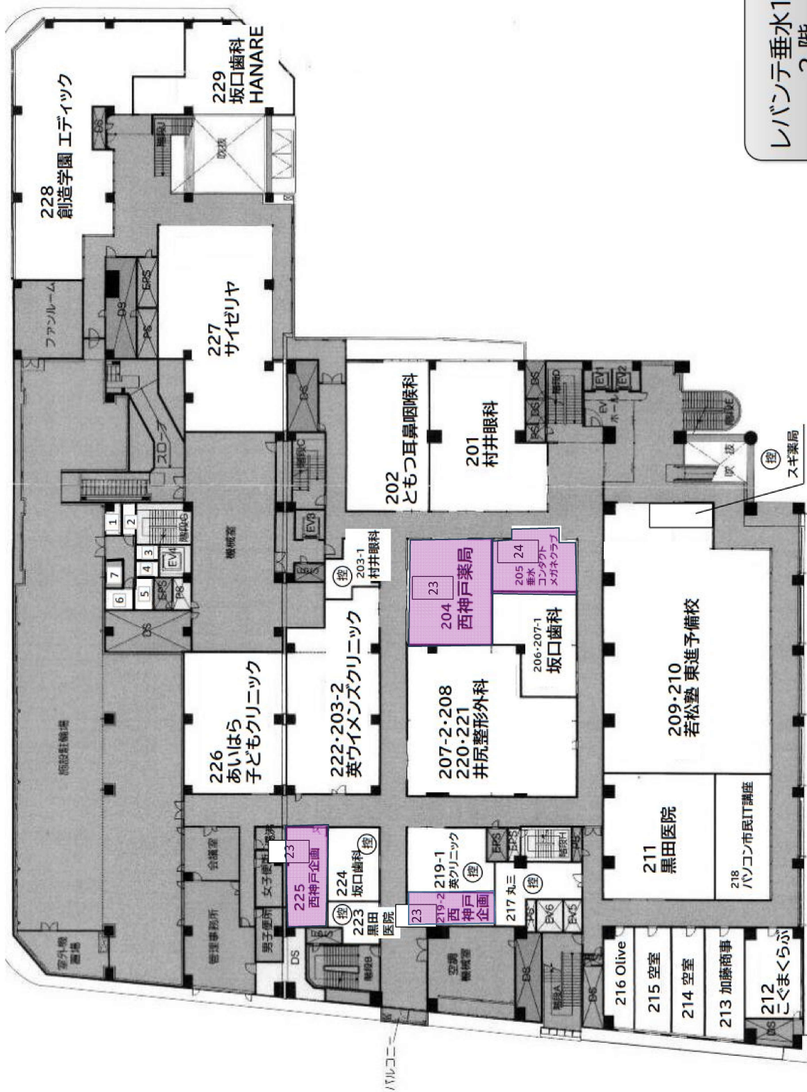
レバンテ垂水1番館 2階