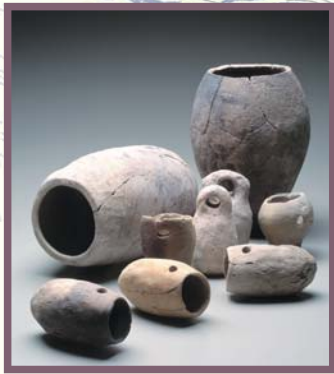
タコ壺 (神戸市内の遺跡出土)