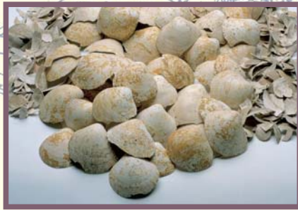
兵庫津遺跡出土の貝殻

おおさかわん 大阪湾に臨み海と浜辺が織り成す美しい景観にあふれた「コウベ」。ここに暮らす人々はこの海から多くの恵みを受けて生活し、その海を あが めてきました。また海は、外の世界から多くのものを受け入れる窓口ともなり、今日の国際交流都市「神戸」を形作る源ともなりました。