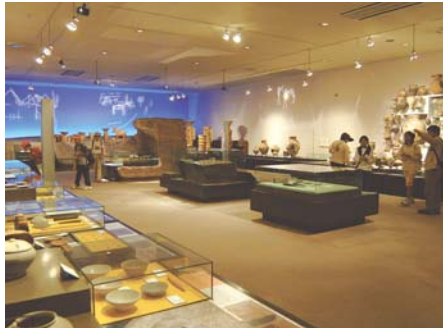
よみがえる神戸の歴史