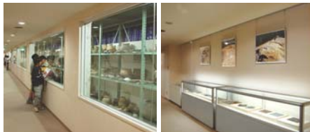
出土資料を一堂に展示