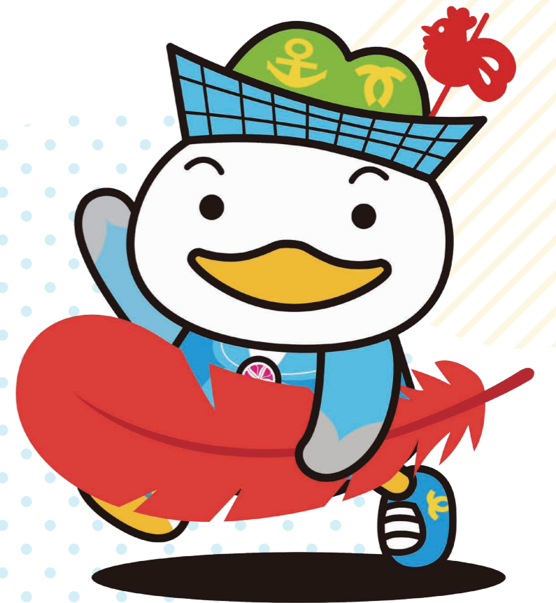
中央区マスコットキャラクター かもめん

赤い羽根共同募金は、じぶんの町を良くするしくみです。 あなたの思いやりが、あなたの地域の福祉のために役立てられます。