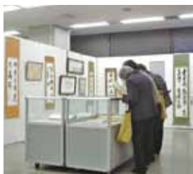
たるみ平成万葉集巻1・2 区役所2階まちづくり課で販売中