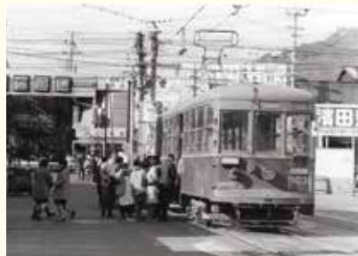
(神戸市電板宿線 板宿停留所)

神戸市電板宿線は、かつて大橋9丁目停留所から板宿停留所を結んでいた路線です。1971年(昭和46年)に神戸市電が全線廃線になるまで、区民の足として活躍しました。