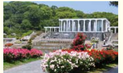
現在の須磨離宮公園