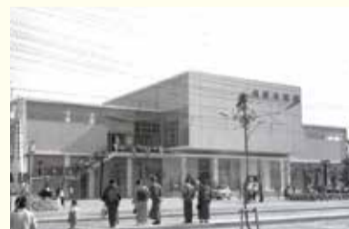
須磨水族館(昭和32年5月10日)

「スマスイ」の愛称で親しまれている須磨海浜水族園。昭和32年に「須磨水族館」として開園し、珍しい世界中の様々な魚類を展示し「東洋一の水族館」と言われました。 今年で開業60周年を迎え、来年2月まで「SUMASUI 60th Anniversary」として様々な記念催事を予定しています。