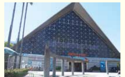
現在の須磨海浜水族園