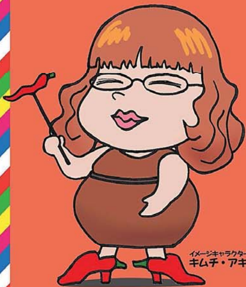
イメージキャラクター キムチ・アキ