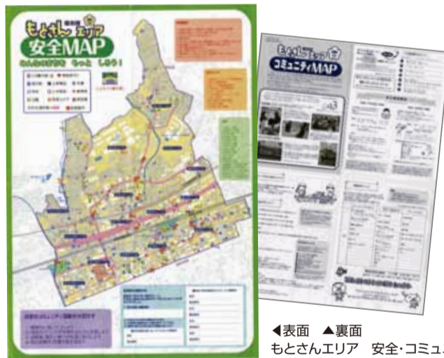
◀表面 ▲裏面 もとさんエリア 安全・コミュニティマップ