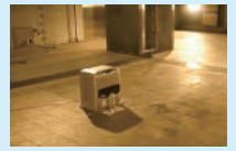
ファンヒーター前にスプレー缶を置くと

また、スプレー缶(制汗スプレー・ヘアスプレー・殺虫剤・パーツクリーナー)には可燃性ガスが使われているため、屋内等で使用する際は付近に火気がないことを確認してから使用し、ストーブや火の近くには置かないようにしてください。