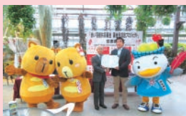
神戸どうぶつ王国 売り上げの一部を募金

園 区共同募金委員会(区社会福祉協議会) ☎232-4411(内線333) FAX232-1244