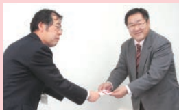
NTT西日本 兵庫支店 会社挙げての募金活動