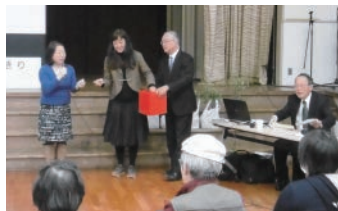
平成28年度助成事業「北野むかし語り—神戸開港秘話—」の様子