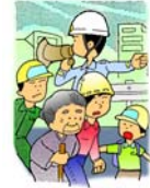
避難勧告や避難指示