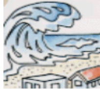
津波警報・注意報