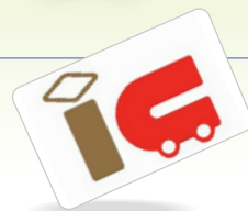
その他の全国相互利用 対象の交通系カード