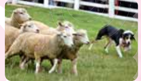
六甲山牧場のヒツジと牧羊犬

性格は穏やかで臆病であるため、群れを作ります。群れのボスなどはおらず、最初に動いたヒツジに他のヒツジがついていく習性があります。この習性を利用して、牧羊犬などで追いかけて目的の場所へ誘導することができます。