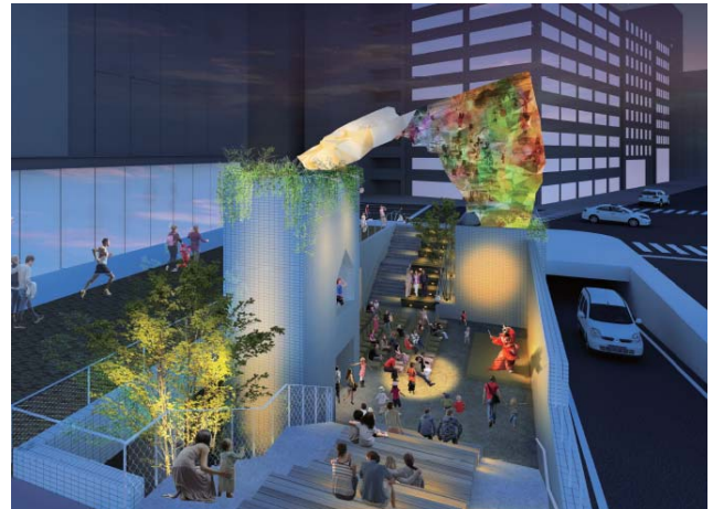
図-1 リニューアル工事完成イメージ