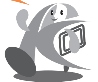
「こうべ男女いきいき事業所」シンボルマーク

神戸市は、男性も女性も、ともにいきいきと働きやすい 職場づくりに向けて積極的に取り組む事業所の裾野を 広げることを目指しています。 今年度も事業所を募集しますのでご応募ください!