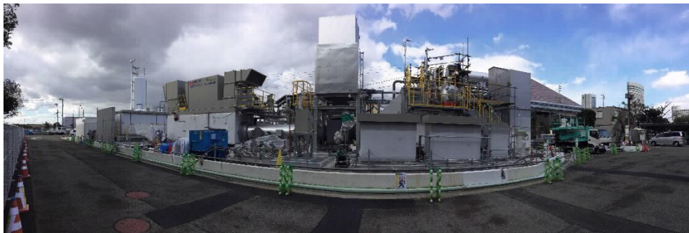
図1 水素コージェネレーションシステムのプラント

実証試験では、水素を燃料とする1MW級ガスタービン発電設備(水素コージェネレーションシステム)から発生させた熱や電気を、病院などの近隣4施設に供給し、地域コミュニティ内でのエネルギー最適制御システムの運用を検証します。