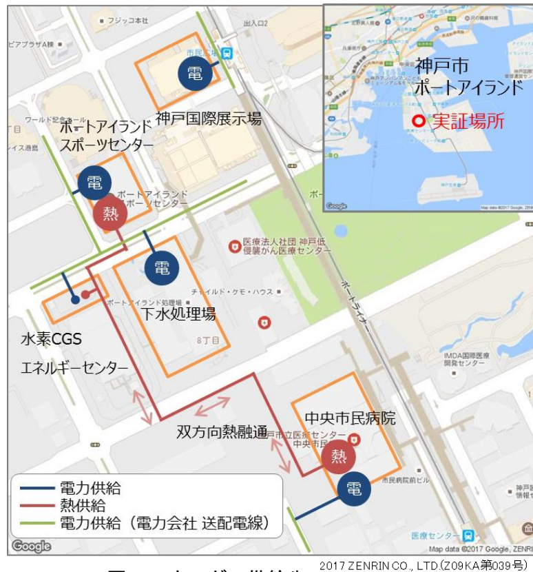
図4 エネルギー供給先