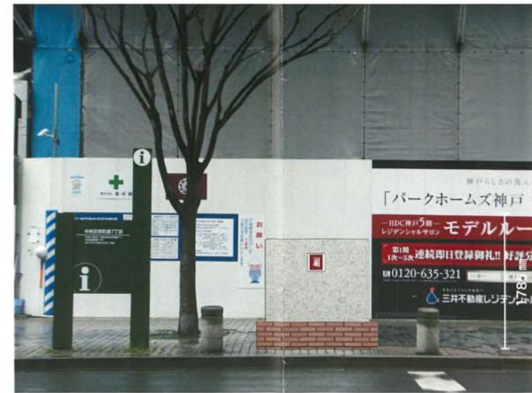
Scale : 1/20 (A3)