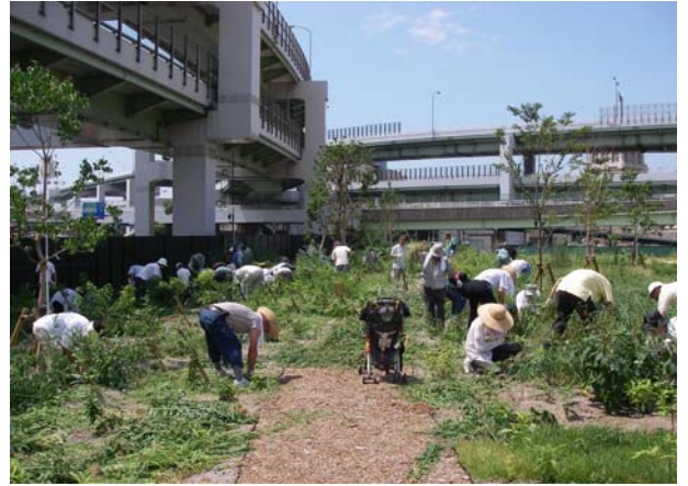
▲草抜き(2008年7月20日) 苗木植樹した場所の草抜きと観察会を開催し ました