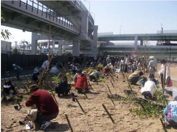
▲第1回苗木植樹会(2008年3月22日) ドングリから育てた苗木を持ち寄っていただき、 植樹(約1,000本)をしました