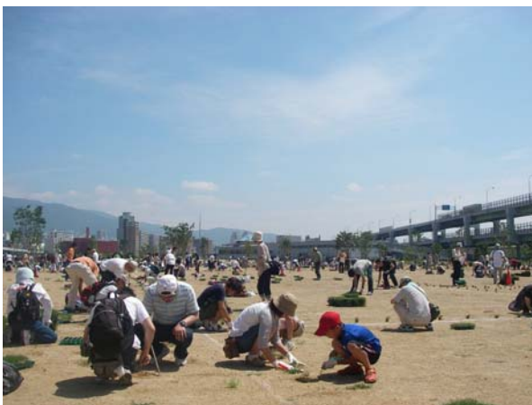
▲芝生ポット植え付け(2009年6月20日) 多目的芝生広場に約72,000ポットの芝生の苗 を植え付けました