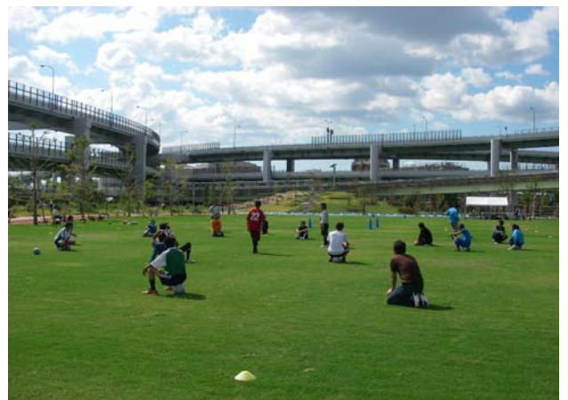
▲芝生広場を楽しもう!(2009年10月11日) できあがった芝生広場を一日開放