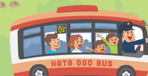
HATA OGO BUS