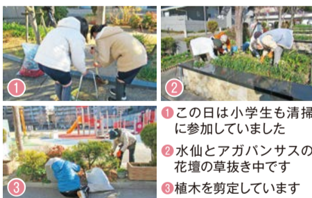
①この日は小学生も清掃に参加していました ②水仙とアガパンサスの花壇の草抜き中です ③植木を剪定しています