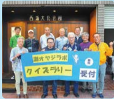
「灘オヤジラボ」企画の補助

地域づくり・まちづくりに関して知識・経験を有する民間の人材が、地域活動支援コーディネーターと「灘オヤジラボ」企画の補助として区役所と協働し、地域の方々の力を最大限に活かしたまちづくりを応援します。