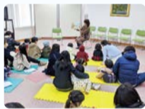
「防災絵本」の製作・読み聞かせ

地域団体の自主性を育て、地域力を高めることを目的として、区内の身近な課題に関する手づくりの活動・事業の初期段階(概ね3カ年以内)に要する経費を補助します。