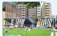
「まちTフェス」開催の様子

区内の大学との協力協定に基づき、教職員や学生が地域の課題の解決および魅力の向上を目的として実施する活動・事業に要する経費を補助します。